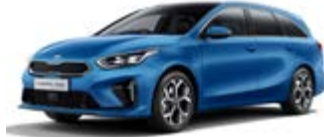
Blue Flame (metalický lak)