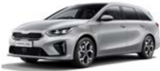
Sparkling Silver (metalický lak)