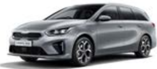
Lunar Silver (metalický lak)