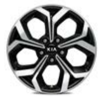
225/45R17-palcové disky kolies z ľahkých zliatin / Platinum