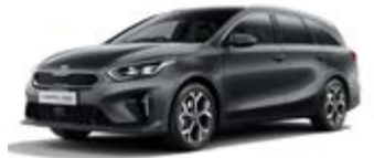
Penta Metal (metalický lak)