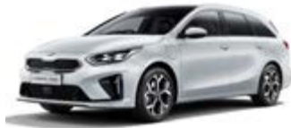
Deluxe White (metalický lak)