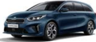
Cosmo Blue (metalický lak)