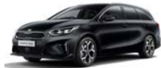
Black Pearl (metalický lak)