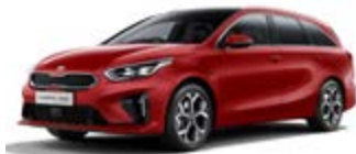
Infra Red (metalický lak)