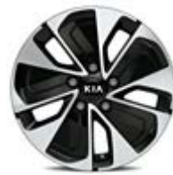
205/55R16-palcové disky kolies z ľahkých zliatin / Gold