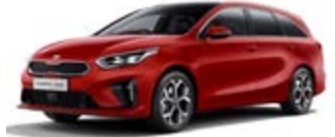
Track Red (nemetický lak)