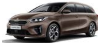
Cooper Stone (metalický lak)