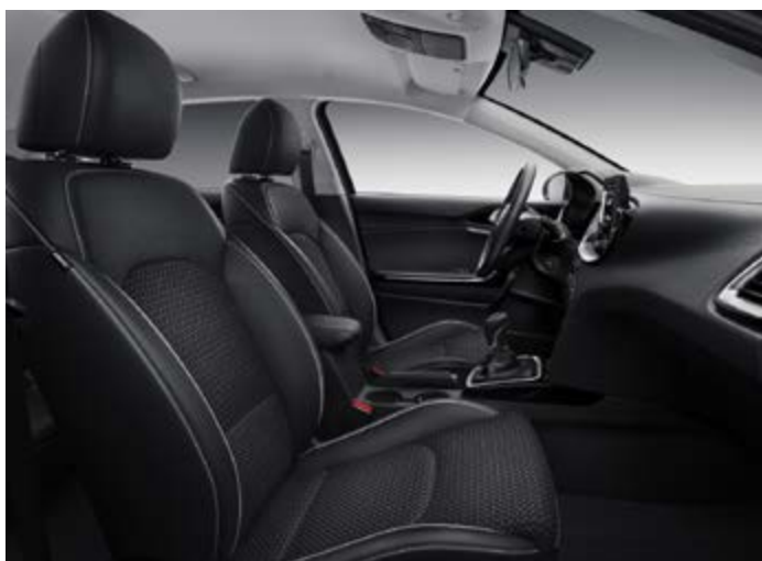
Čierna látka / koža