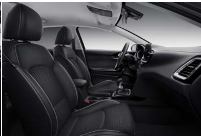
Čierna látka a koža