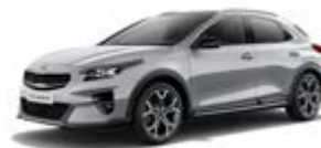
Sparkling Silver (metalický lak)