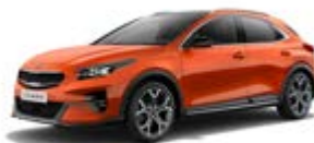
Orange Fusion (metalický lak)