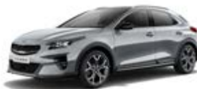
Lunar Silver (metalický lak)