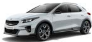
Cassa White (nemetický lak)