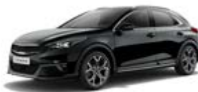
Black Pearl (metalický lak)