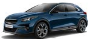
Cosmos Blue (metalický lak)