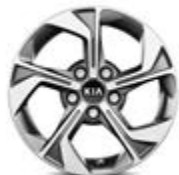
16-palcové disky kolies z ľahkých zliatin