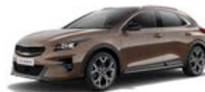
Copper Stone (metalický lak)