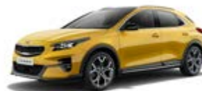
Quantum Yellow (metalický lak)