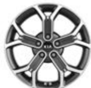
18-palcové disky kolies z ľahkých zliatin