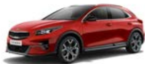
Infra Red (metalický lak)