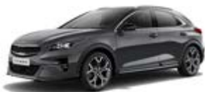
Penta Metal (metalický lak)