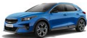
Blue Flame (metalický lak)