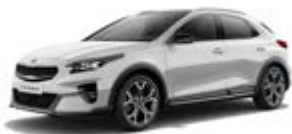
Deluxe White (metalický lak)