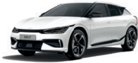
Snow White Pearl (perleťový lak)