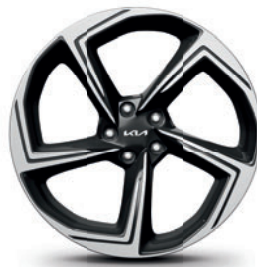
21-palcové disky kolies z ľahkých zliatin (pneumatiky 255/40 R21)