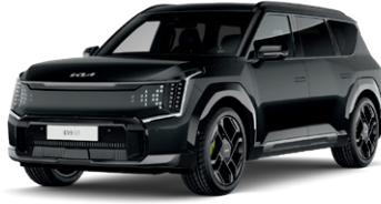
Aurora Black Pearl (lesklý lak)