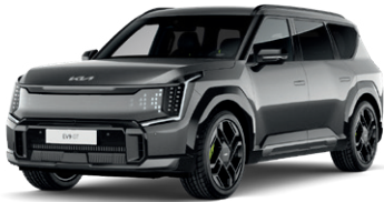
Pebble Gray (lesklý lak)