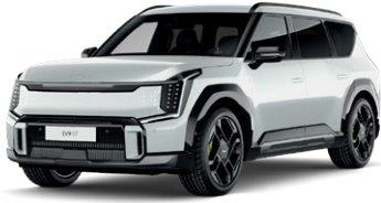
Snow White Pearl (lesklý lak)