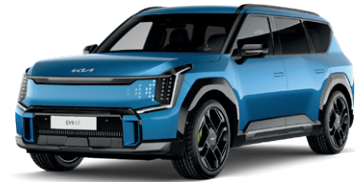
Ocean Blue (lesklý lak)