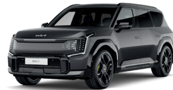
Panthera Metal (lesklý lak)