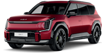
Flare Red (lesklý lak bez príplatku)