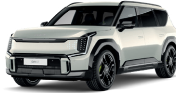
Ivory Silver (lesklý lak)