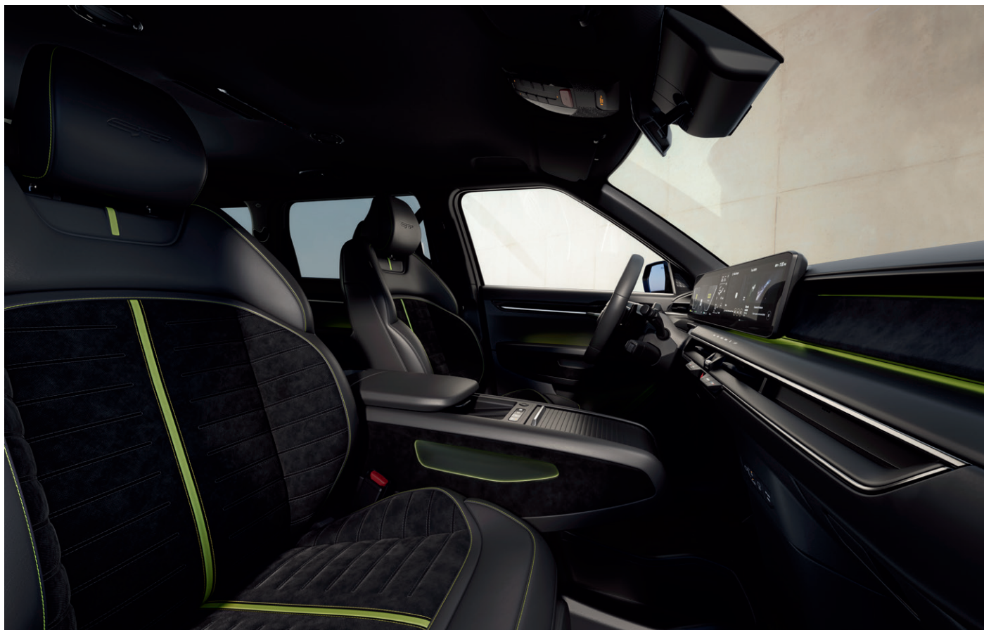
Alcantarou čalúnené športové sedadlá s logom GT