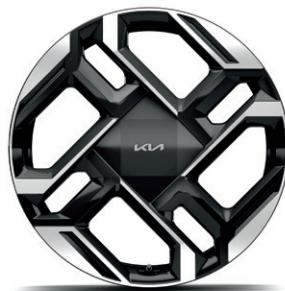
21-palcové disky kolies z ľahkých zliatin (pneumatiky 285/45 R21)